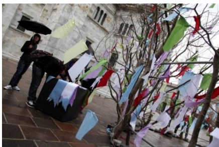
Gli alberi della memoria, Alfredo Ratti